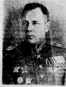
Главный Маршал авиации А. А. Новиков.