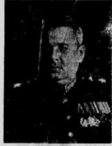
Маршал бронетанковых войск Я. И. Федорченко.