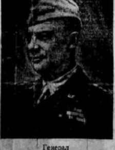
Генерал Д. Эйзенгауэр.