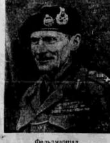
Фельдмаршал Б. Монтгомери.