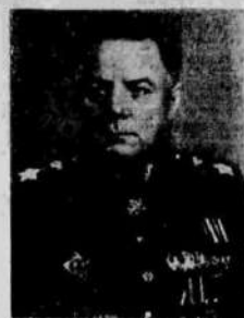
Маршал Советского Союза К. Ф. Вороников.