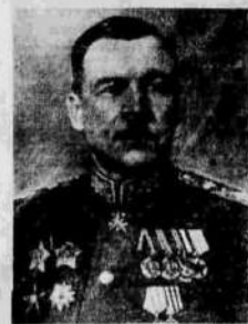
Маршал Советского Союза Л. А. Говоров.