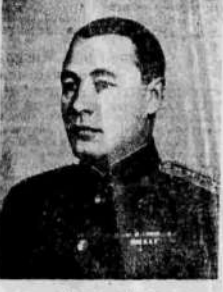
Адмирал флота Н. Г. Кузнецов.