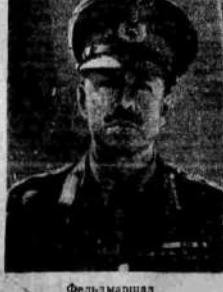
Фельдмаршал Г. Александер.