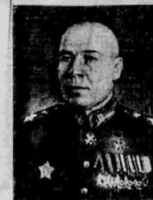
Маршал Советского Союза С. К. Тимошенко.