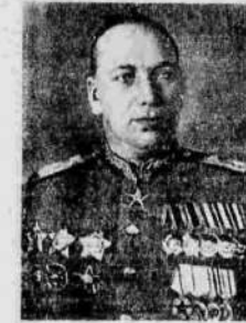
Главный Маршал артиллерии Н. Н. Воронов.