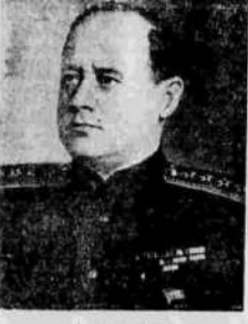
Адмирал флота Н. С. Исаков.