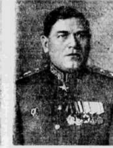
Маршал инженерных войск М. П. Воробьев.