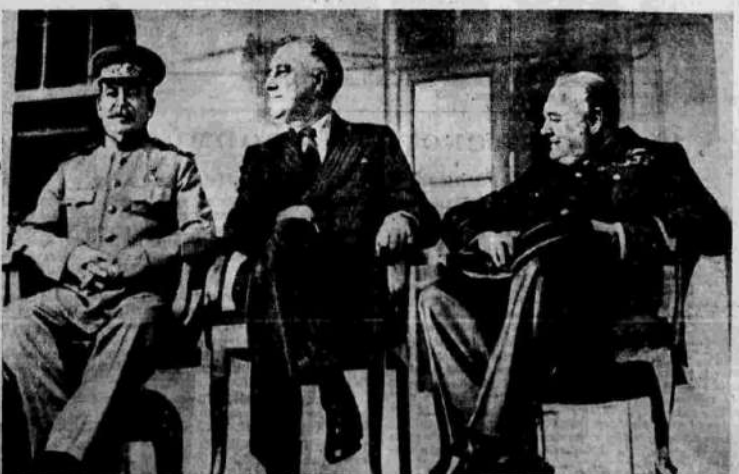
И. В. Сталин, Ф. Д. Рузвельт и У. Черчилль в дни Тегеранской конференции.

С победой вас, мои дорогие соотечественники и соотечественницы! СЛАВА НАШЕЙ ГЕРОИЧЕСКОЙ КРАСНОЙ АРМИИ, ОТСТОЯВШЕЙ НЕЗАВИСИМОСТЬ НАШЕЙ РОДИНЫ И ЗАВОЕВАВШЕЙ ПОБЕДУ НАД ВРАГОМ! СЛАВА НАШЕМУ ВЕЛИКОМУ НАРОДУ, НАРОДУ-ПОБЕДИТЕЛЮ! ВЕЧНАЯ СЛАВА ГЕРОЯМ, ПАВШИМ В БОЯХ С ВРАГОМ И ОТДАВШИМ СВОЮ ЖИЗНЬ ЗА СВОБОДУ И СЧАСТЬЕ НАШЕГО НАРОДА!