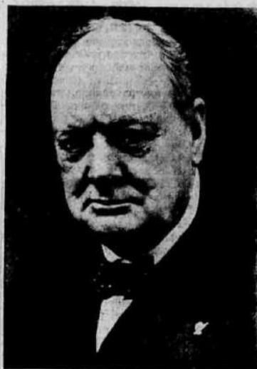
Премьер-министр Великобритании У. Черчилль.