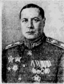
Маршал Советского Союза Ф. И. Толбухин.