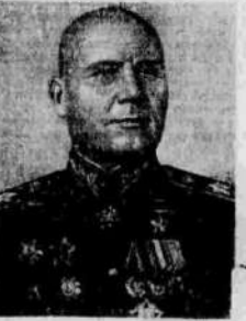
Маршал Советского Союза Н. С. Конев.