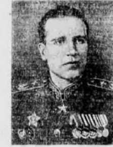
Главный Маршал авиации А. Е. Голованов.