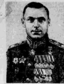
Маршал Советского Союза К. К. Рокоссовский.