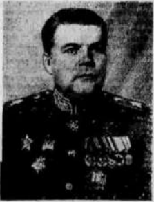
Маршал Советского Союза Р. Я. Малиновский.