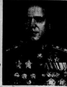
Маршал Советского Союза Г. К. Жуков.

Созданный Лениным и Сталиным, партия большевиков и ее силы в самые тяжелые годы реакции звали народ к борьбе. В годы реакции строились советские государства партия Ленин — Сталина была в первых рядах, ее члены были за самыми трудными участками строительства, и народ был с партией, шел за ней, да ей инициатива с борьбой и победой.