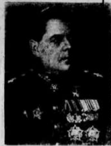
Маршал Советского Союза А. М. Васильевский.