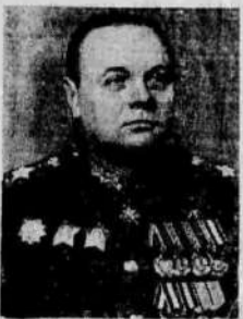
Маршал Советского Союза К. А. Мерецков.