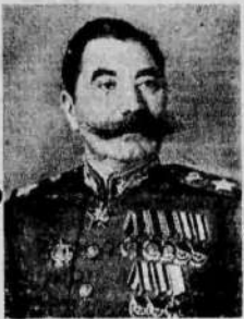
Маршал Советского Союза С. М. Буденный.