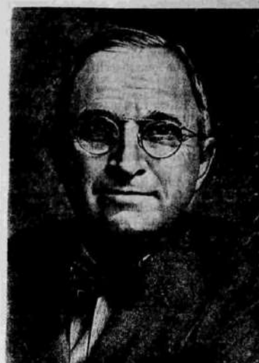
Президент США Г. Трумэн.