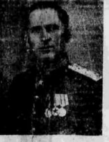
Маршал войск связи И. Т. Персыпкин.